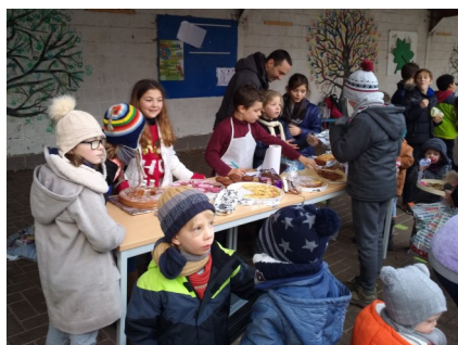
les parents et les élèves. Les élèves de P4

cours. Les parents de P4 ont pris le temps de préparer des gâteaux, des biscuits, des brochettes de bonbons, ... Les enfants ont tous participé en vendant, en rangeant, en distribuant des publicités. Grâce à vous, nous avons déjà récolté 251 €. Nous remercions du fond du cœur ceux qui nous ont aidés : la direction, les professeurs,